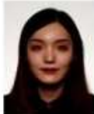
Foto deve ser clara e bem definida com luz suficiente

O rosto não pode ser obstruído por nenhum objeto.