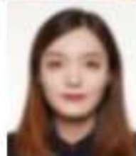
Foto deve estar em foco

Expressão deve ser neutra e boca fechada (ser sorrir)