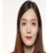
Foto não pode estar distorcida